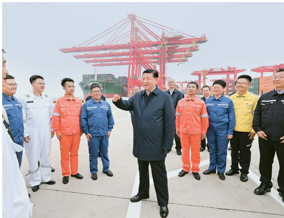
2024年5月22日至24日，中共中央总书记、国家主席、中央军委主席习近平在山东考察。这是22日下午，习近平在日照港亲切慰问港口科技工作者、运营人员、航运人员。