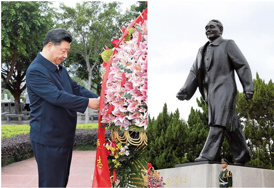
2020年10月14日，深圳经济特区建立40周年庆祝大会在广东省深圳市隆重举行。中共中央总书记、国家主席、中央军委主席习近平在会上发表重要讲话。这是当天下午，习近平来到莲花山公园，向邓小平同志铜像敬献花篮。