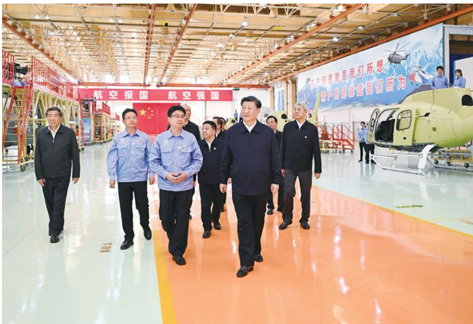
2023年10月10日至13日，中共中央总书记、国家主席、中央军委主席习近平在江西考察。这是11日上午，习近平在景德镇市昌河飞机工业（集团）有限公司考察。