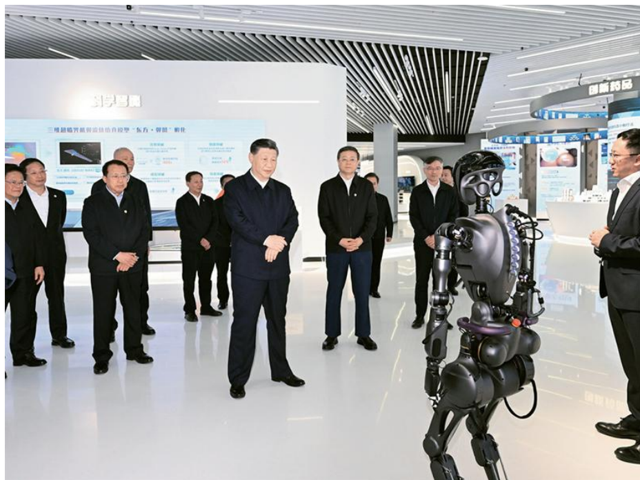
2023年11月28日至12月2日，中共中央总书记、国家主席、中央军委主席习近平在上海考察。这是11月28日下午，习近平在浦东新区张江科学城参观上海科技创新成果展。

(2021年1月11日在省部级主要领导干部学习贯彻党的十九届五中全会精神专题研讨班上的讲话)