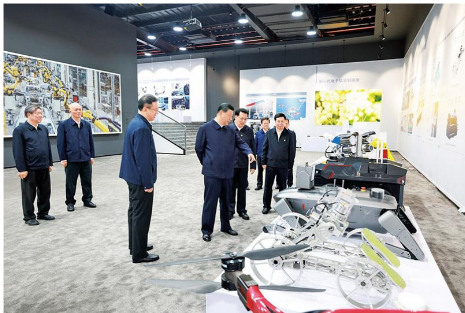
2024年4月22日至24日，中共中央总书记、国家主席、中央军委主席习近平在重庆考察。这是22日下午，习近平参观重庆科技创新和产业发展成果展示。