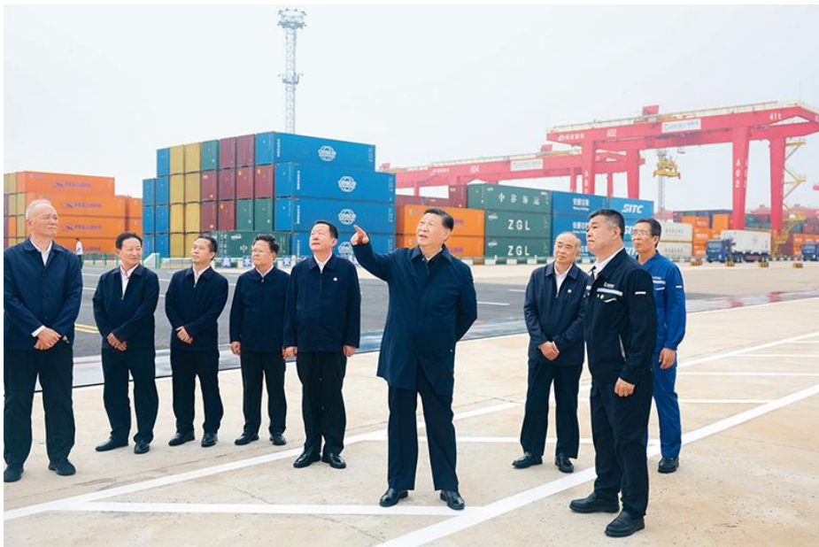
2024年5月22日至24日，中共中央总书记、国家主席、中央军委主席习近平在山东考察。这是22日下午，习近平在日照港察看全自动化集装箱码头作业场景。

第二，以科技创新推动产业创新。 科技成果转化为实现生产力，表现形式为催生新产业、推动产业深度转型升级。因此，我们要及时将科技创新成果应用到具体产业和产业链上，改造提升传统产业，培育壮大新兴产业，布局建设未来产业，完善现代化产业体系。要围绕发展新质生产力布局产业链，推动短板产业补链、优势产业延链、传统产业升链、新兴产业建链，提升产业链供应链韧性和安全水平，保证产业体系自主可控、安全可靠。要围绕推进新型工业化和加快建设制造强国、质量强国、网络强国、数字中国等战略任务，科学布局科技创新、产业创新。要大力发展数字经济，促进数字经济和实体经济深度融合，打造具有国际竞争力的数字产业集群。要围绕建设农业强国目标，加大种业、农机等科技创新和创新成果应用，用创新科技推进现代农业发展，保障国家粮食安全。