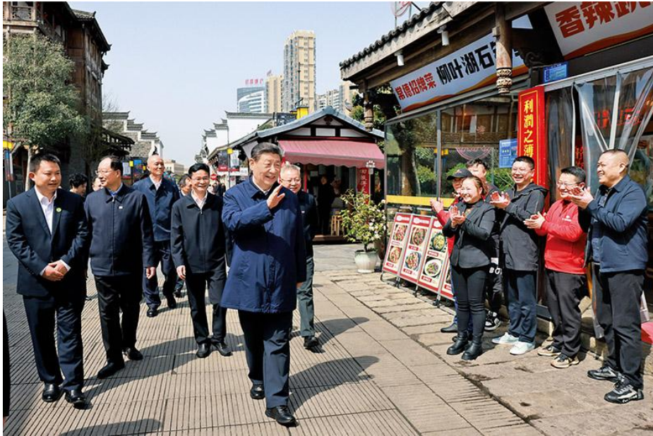
2024年3月18日至21日，中共中央总书记、国家主席、中央军委主席习近平在湖南考察。这是19日上午，习近平在常德河街考察时，同店主和游客亲切交流。