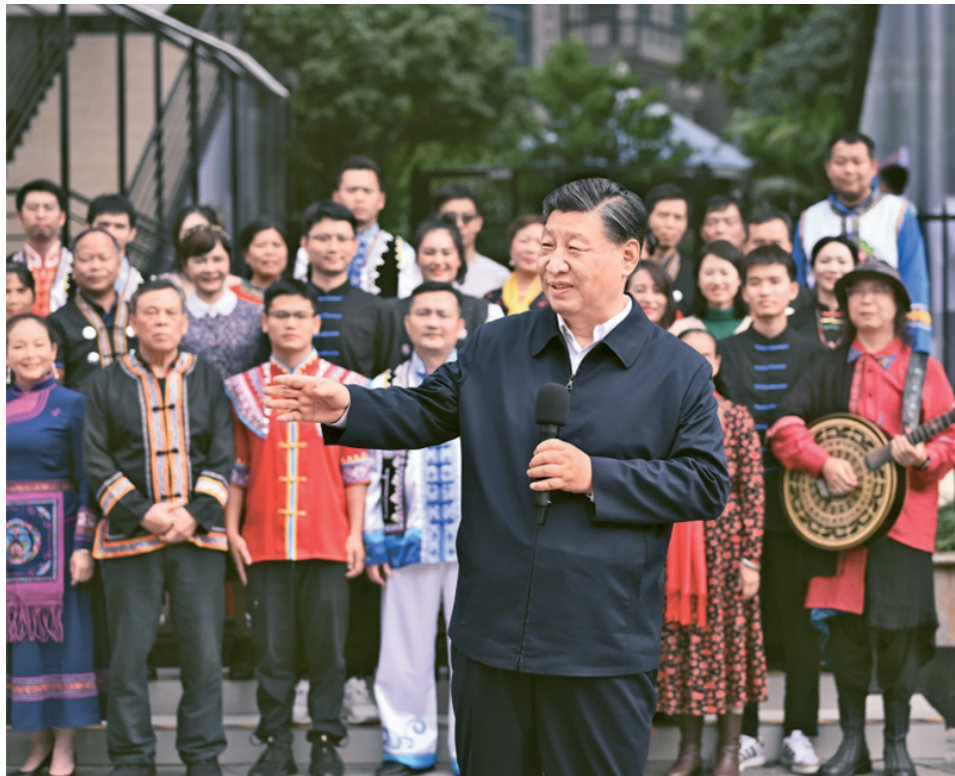
2023年12月14日至15日，中共中央总书记、国家主席、中央军委主席习近平在广西考察。这是14日上午，习近平在南宁市良庆区蟠龙社区考察时，同社区各族群众亲切交流。

要保持战略自信，增强斗争的底气。底气来自哪里？来自我国越来越厚实家底，更来自坚定的理想信念、执着的真理追求，对党的初心使命的始终坚守。面对围堵、遏制、打压，我们应理直气壮地进行斗争，因为我们始终站在历史正确的一边，站在人类文明进步的一边，推动建设持久和平、普遍安全、共同繁荣、开放包容、清洁美丽的世界，为维护世界和平和地区稳定发挥建设性作用，走的是人间正道，干的是正义事业。而霸权主义、强权政治、单边主义、保护主义违背时代潮流，不得人心、失道寡助。面对改革发展稳定中的矛盾和问题，我们要迎难而上、攻坚克难，因为我们的事业从来就是在解决矛盾中前进的，只有逢山开路、遇水架桥，以一往无前的精神破除一切障碍，扫除一切拦路虎，才能推动事业行稳致远。同样，面对党内存在的突出问题，我们要敢抓敢管、严管严治，因为全面从严治党是自我革命的伟大实践，是保持马克思主义政党先进性纯洁性的根本途径，只有严格要求、严格教育、严格管理、严格监督，才能保持党的团结统一、确保党始终充满生机活力。