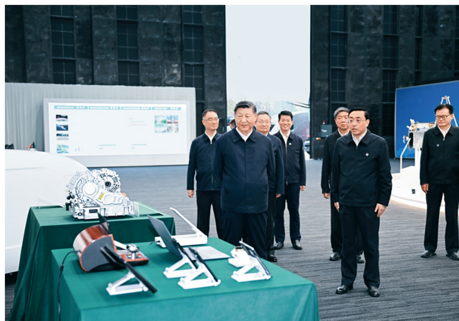
2024年10月17日至18日，中共中央总书记、国家主席、中央军委主席习近平在安徽考察。这是17日下午，习近平在合肥滨湖科学城察看安徽省重大科技创新成果集中展示。

度、基本制度、重要制度等在内的一整套制度体系，为中国式现代化稳步前行提供坚强制度保证。我们党坚持和发展中国特色社会主义文化，激发全民族文化创新创造活力，为中国式现代化提供强大精神力量。可以说，只有毫不动摇坚持党的领导，中国式现代化才能前景光明、繁荣兴盛；否则，中国式现代化就会偏离航向、丧失灵魂，甚至犯颠覆性错误。