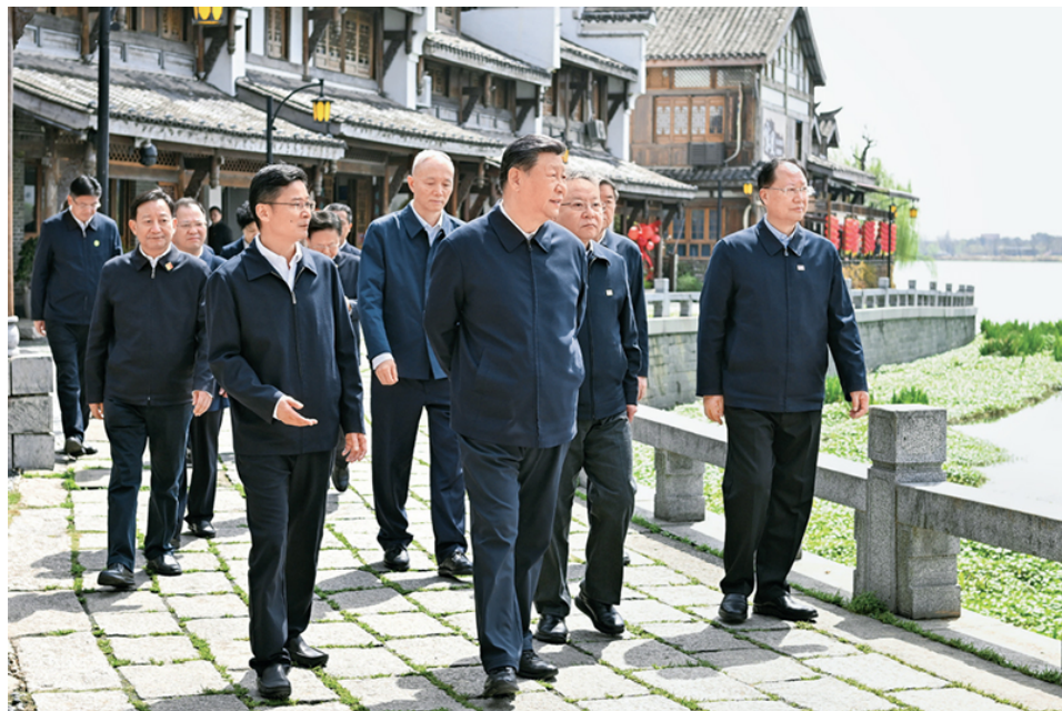
2024年3月18日至21日，中共中央总书记、国家主席、中央军委主席习近平在湖南考察。这是19日上午，习近平在常德河街考察。

围，让创新在全社会蔚然成风。各级领导干部要加快转变不适应创新发展要求的思想观念、思维方式、行为方式和工作方法，真正成为创新的引领者、推动者。