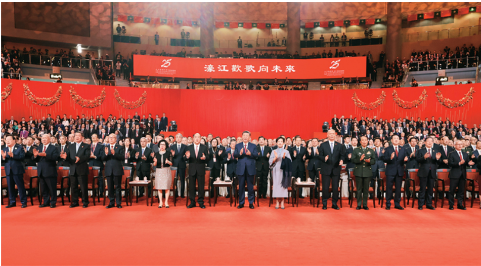
2024年12月19日晚，庆祝澳门回归祖国25周年文艺晚会在澳门东亚运动会体育馆举行。中共中央总书记、国家主席、中央军委主席习近平观看演出。晚会最后，习近平同全场观众一起高唱《歌唱祖国》。

党的十八大以来，我们党在已有基础上继续前进，坚持问题导向，围绕解决现代化建设中存在的突出矛盾和问题，全面深化改革，不断实现理论和实践上的创新突破，成功推进和拓展了中国式现代化。10年来，我们在认识上不断深化，创立了新时代中国特色社会主义思想，实现了马克思主义中国化时代化新的飞跃，为中国式现代化提供了根本遵循。我们进一步深化对中国式现代化的内涵和本质的认识，概括形成中国式现代化的中国特色、本质要求和重大原则，初步构建中国式现代化的理论体系，使中国式现代化更加清晰、更加科学、更加可感可行。我们在战略上不断完善，作出到本世纪中叶把我国建成富强民主文明和谐美丽的社会主义现代化强国“两步走”的战略安排，明确“五位一体”总体布局和“四个全面”战略布局，深入实施科教兴国战略、人才强国战略、乡村振兴战略等一系列重大战略，为中国式现代化提供坚实战略支撑。我们在实践上不断丰富，推进一系列变革性实践、实现一系列突破性进展、取得一系列标志性成果，特别是消除了绝对贫困问题，全面建成小康社会，推动党和国家事业取得历史性成就、发生历史性变革，为中国式现代化提供了更为完善的制度保证、更为坚实的物质基础、更为主动的精神力量。