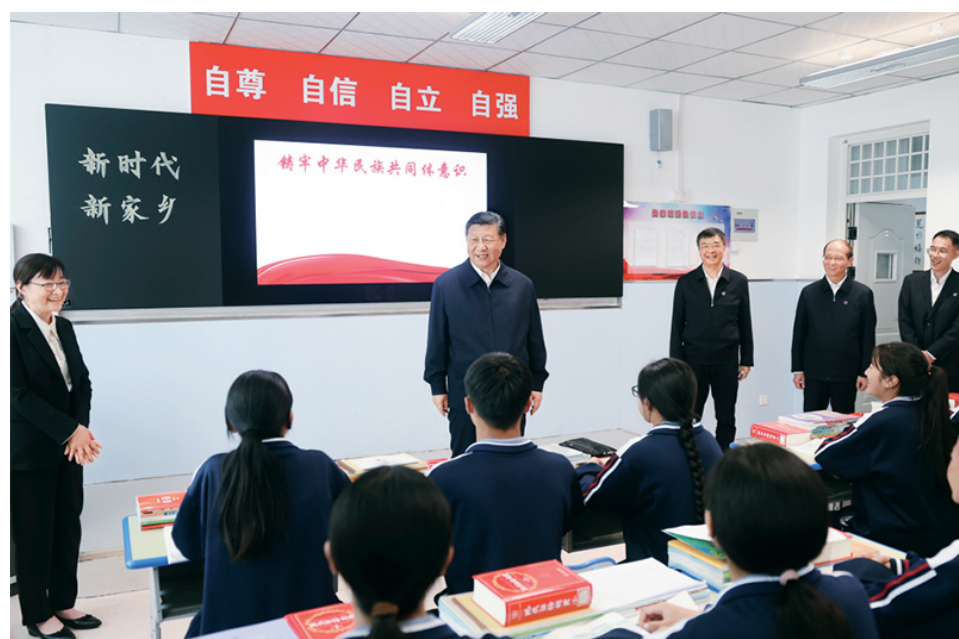
2024年6月18日至19日，中共中央总书记、国家主席、中央军委主席习近平在青海考察。这是18日下午，习近平在果洛西宁市民族中学高一（1）班观摩“新时代、新家乡”主题思政课。

结合、上下贯通、内容协调。同时，推进中国式现代化是一个探索性事业，还有许多未知领域，需要我们在实践中去大胆探索，通过改革创新来推动事业发展，决不能刻舟求剑、守株待兔。各地区各部门要结合各自具体实际开拓创新，特别是在前沿实践、未知领域，鼓励大胆探索、敢为人先，寻求有效解决新矛盾新问题的思路 and 办法，努力创造可复制、可推广的新鲜经验。