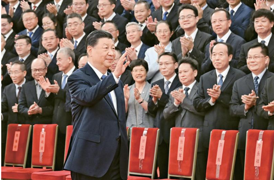
2024年9月23日，党和国家领导人习近平、李强、赵乐际、王沪宁、蔡奇、丁薛祥、李希等在人民大会堂接见探月工程嫦娥六号任务参研参试人员代表并参观月球样品和探月工程成果展览。这是习近平等接见探月工程嫦娥六号任务参研参试人员代表。

近年来，为科研人员松绑减负工作取得了积极进展，但也有不少科研人员反映，各种非学术负担仍然较重。要坚持“破四唯”和“立新标”相结合，加快健全符合科研活动规律的分类评价体系和考核机制。要完善科技奖励、收入分配、成果赋权等激励制度，让更多优秀人才得到合理回报、释放创新活力。要持续整治滥发“帽子”、“牌子”之风，让科研人员心无旁骛、潜心钻研，切实减少为报项目、发论文、评奖励、争资源而分心伤神。