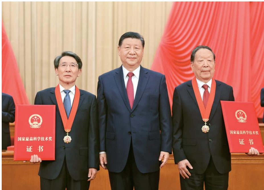
2024年6月24日，全国科技大会、国家科学技术奖励大会和中国科学院第二十一次院士大会、中国工程院第十七次院士大会在北京人民大会堂隆重召开。中共中央总书记、国家主席、中央军委主席习近平向获得2023年度国家最高科学技术奖的武汉大学李德仁院士（右）和清华大学薛其坤院士（左）颁奖。

第一，充分发挥新型举国体制优势，加快推进高水平科技自立自强。 要完善党中央对科技工作集中统一领导的体制，加强战略规划、政策措施、重大任务、科研力量、资源平台、区域创新等方面的统筹，构建协同高效的决策指挥体系和组织实施体系，凝聚推动科技创新的强大合力。要充分发挥市场在科技资源配置中的决定性作用，更好发挥政府各方面作用，调动产学研各环节的积极性，形成共促关键核心技术攻关的工作格局。要加强国家战略科技力量建设，优化定位和布局，完善国家实验室体系，增强国家创新体系一体化能力。要保持战略定力，坚持有所为有所不为，突出国家战略需求，在若干重要领域实施科技战略部署，凝练实施一批新的重大科技项目，形成竞争优势，赢得战略主动。要提高基础研究组织化程度，完善竞争性支持和稳定支持相结合的投入机制，强化面向重大科学问题的协同攻关，同时鼓励自由探索，努力提出原创基础理论、掌握底层技术原理，筑牢科技创新根基和底座。